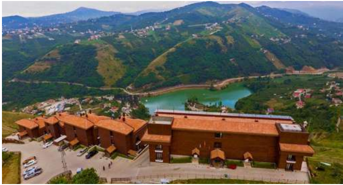
Trabzon SERA LAKE HOTEL 4*