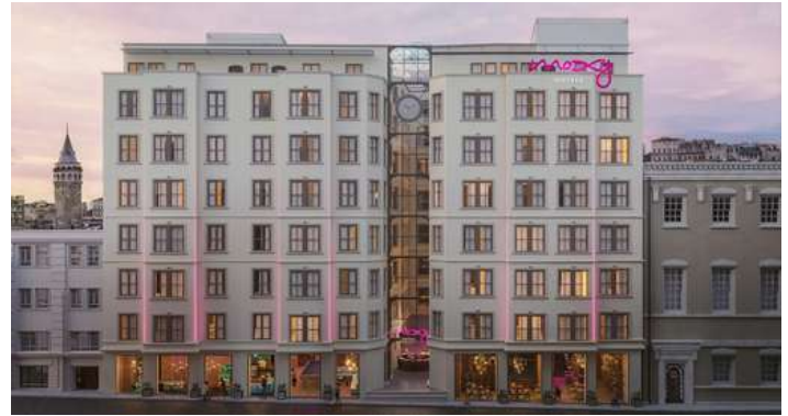
Istanbul Moxy Hôtel Taksim by Marriott 4*